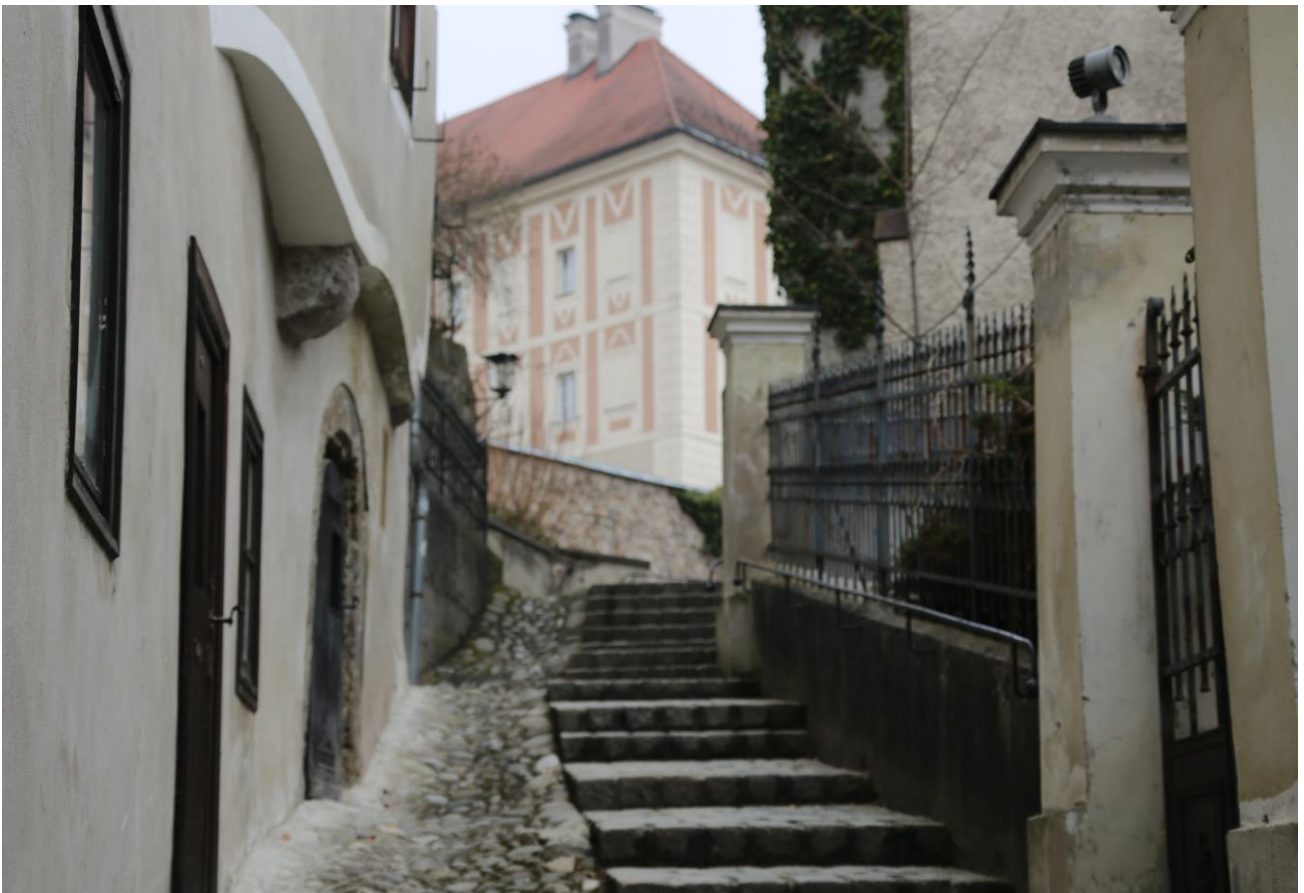
Viele Stufen waren zu bewältigen